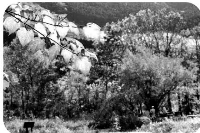
カエテの仲間が色付き、紅葉の美しい季節を迎えた園内の様子(11月4日撮影)

(花) アシズリノジギク (実) マユミ (紅葉) オオモミジ チドリノキ メグスリノキ ヤクシマオナガカエデ ほか