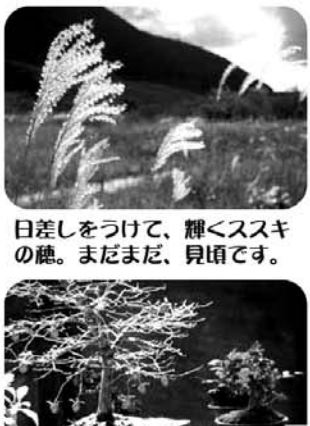
日差しをつけて、輝くススキの穂。まだまだ、見頃です。