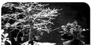
秋の山野草と盆栽展の開催は、11月10日まで。

【観察場所記号】サ:サービスヤード ①:落葉広葉樹林(乾生林)区 ②:スキキ草原区 ③:低層湿原区 ④:ヌマガヤ草原区 ⑤:高山のお花畑区 ⑥:高層湿原区 岩:岩場植物区 ⑦:仙石原湿原区 ⑧:湿生林区 植:植生復元区