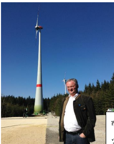
市民風車の前に立つ ツエンゲレ町長

★受賞歴：2010 年と 2014 年『ヨーロッパ・エネルギー・アワード』、『Un bosco per Kyoto』など多数