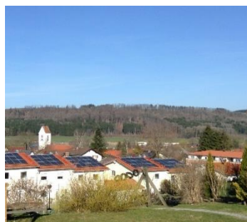
ヴィルトポルスリートの町（上）、バイオガスプラント（下）